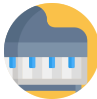
Piano o teclado